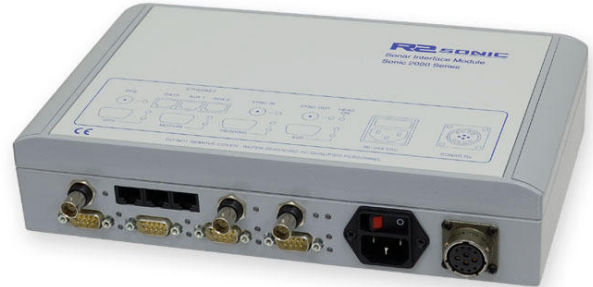
Sonar Interface Module

R2Sonic, LLC 1503-A Cook Place Santa Barbara, California 93117 USA Tel: +1 805 967 9192 www.R2Sonic.com